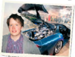
Den 10-12 juli tillfyller Arena Vänersborg med en helt ny upplevelse i Rydboholm med hängiga lister, färgiga motorycklar och spännande föreläsningar som till exempel om bilens historia. Tanken är att showen ska ålocka mer än 5 000 besökare.

Det allra första evenemanget i Arena Vänersborg blir West Coast Motor Show. Det blir en helt ny upplevelse i Rydboholm med hängiga lister, färgiga motorycklar och spännande föreläsningar som till exempel om bilens historia. Tanken är att showen ska ålocka mer än 5 000 besökare.