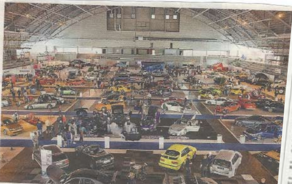
Motorshowen för ett par veckor sedan i Arena Vänersborg blev en succé.